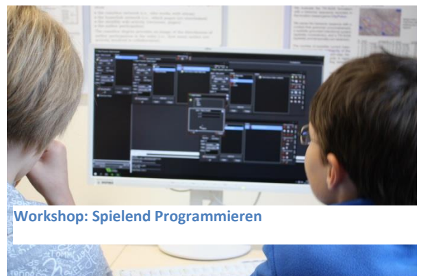
Workshop: Spielend Programmieren