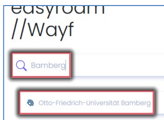
Abbildung 1: Auswahl Universität Bamberg

Besuchen Sie https://www.easyroom.de/ , geben Sie bei Sucheingabe Bamberg ein und wählen hier die Otto-Friedrich-Universität Bamberg aus. Anschließend können Sie sich per Shibboleth mit Ihrer BA-Nummer und dem dazugehörigen Kennwort anmelden.