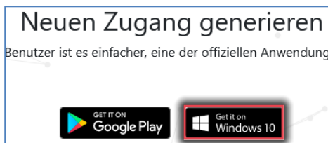
Abbildung 2: Installationsdatei herunterladen

Hinweis: Lassen Sie den Browser geöffnet und bleiben Sie weiterhin in easyroom.de angemeldet, bis die Einrichtung abgeschlossen ist.