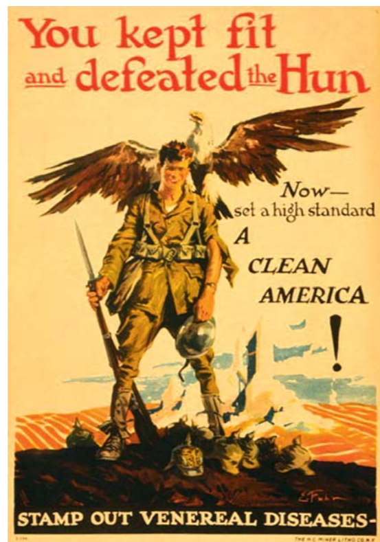
Die Verbreitung der neuartigen Latexkondome wurde seit den 1920er Jahren und vor allem im Zweiten Weltkrieg gefördert durch die Kampagnen des Militärs gegen die Ausbreitung sexuell übertragbarer Krankheiten (Plakat USA 1919/20).

Abgesehen von den auf die arabische Welt hin orientierten Ländern des Maghreb (einschließlich ihrer südlichen Verlängerung entlang der Küste bis nach Guinea) behielten alle französischen Kolonien (mit der bemerkenswerten Ausnahme der ehemaligen deutschen Schutzgebiete Togo und Kamerun, die erst 1918 als Mandatsgebiete vom Völkerbund an Frankreich übergeben wurden) die Straffreiheit gleichgeschlechtlicher Handlungen bei. Gleiches gilt für den Belgischen Kongo und die meisten der portugiesischen Kolonien.